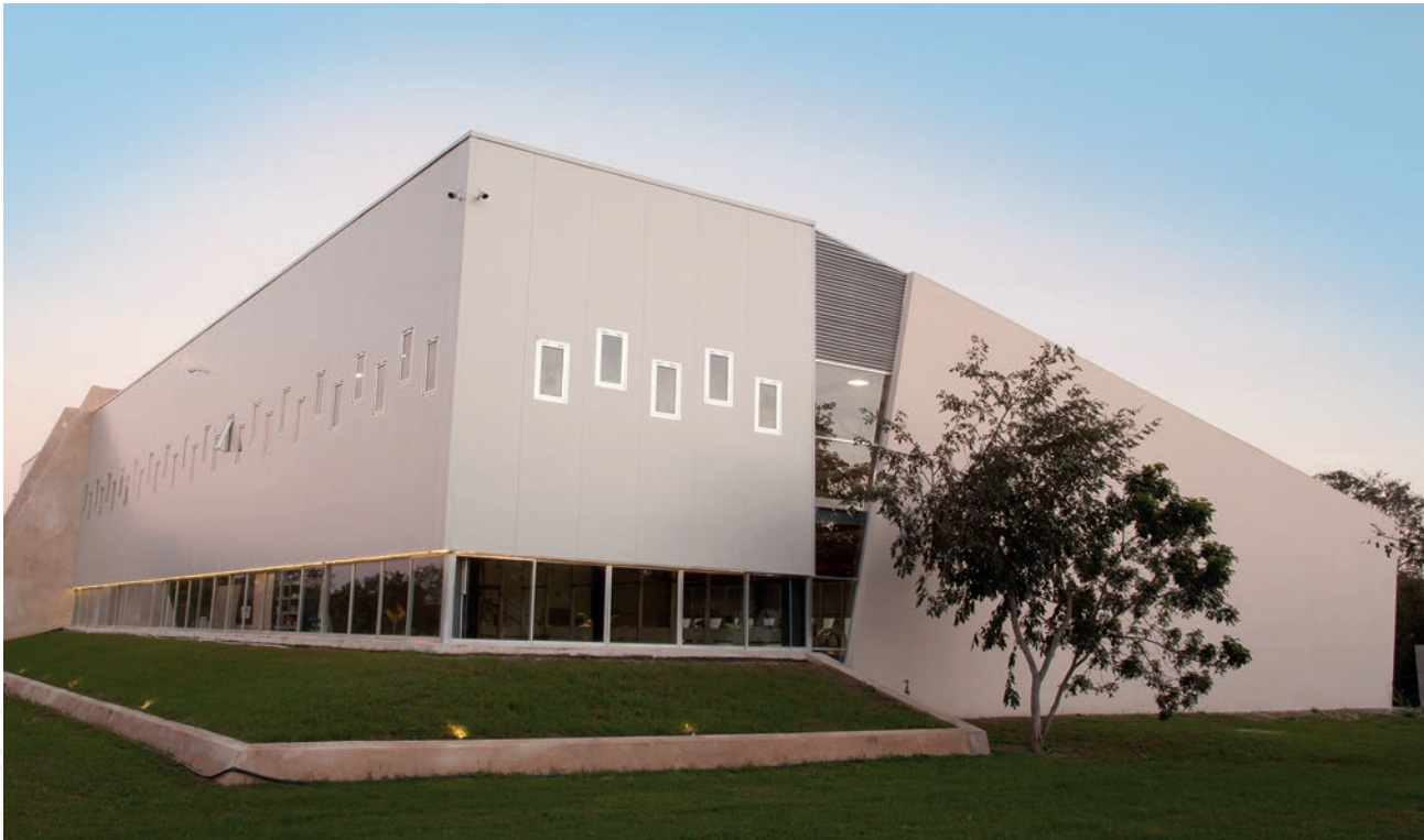
Cumple con la norma: NOM-008-ZOO-1994.